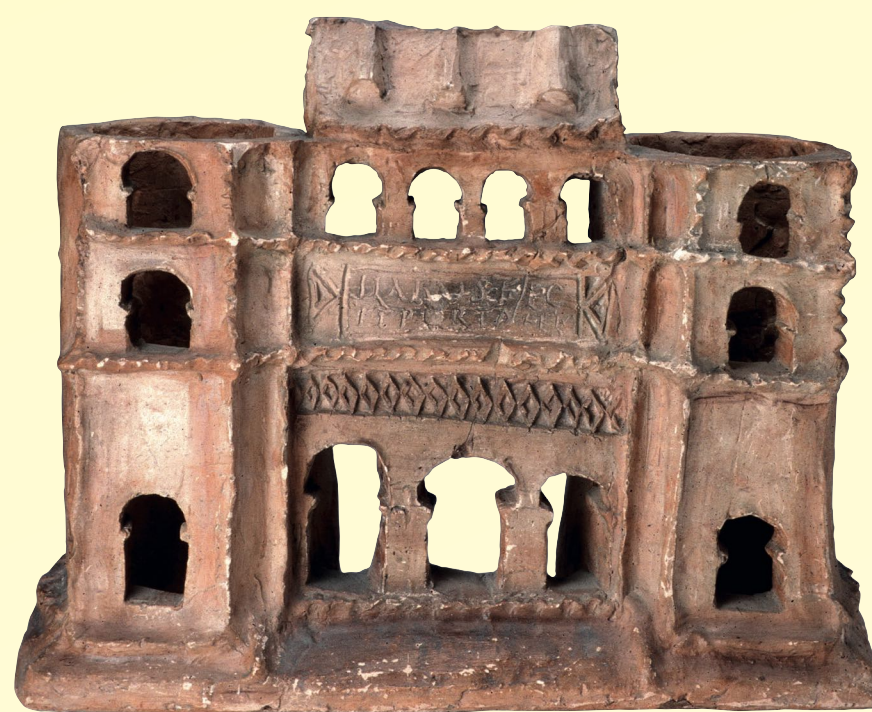
Kapuépítményt ábrázoló épületmodell Intercisából (Dunaújváros). A közepen látható felirat szerint Hilarus mester készítette, aki feltehetően azonos az Aquincumban is tevékenykedő agyagművessel.