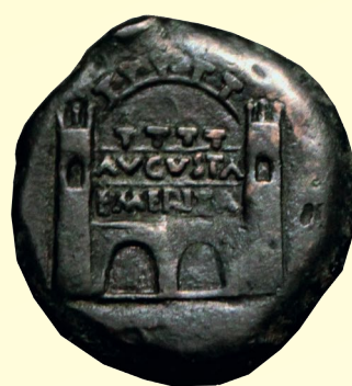
Augusta Emerita városának kapuja egy Augustus császár által kibocsátott pénzérme hátlapján.