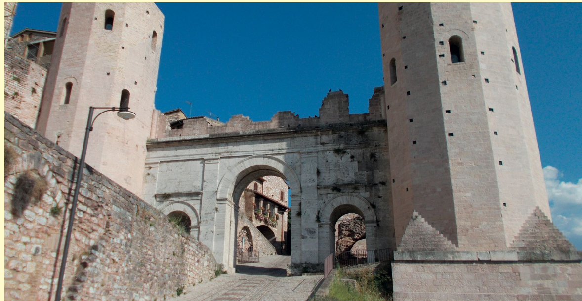
Hispellum (Spello, Olaszország) városkapuja.

A kapu ma ismert formájában a Kr. u. 3. század második felében épült. Eredeti kinézetére csak következtetni tudunk, jobb állapotban fennmaradt hasonló kapuépítmények, épületmodellek és éremábrázolások alapján.