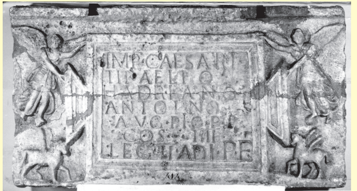
Feltételezhetően ez a kőből készült építési felirat tartozott az amfiteátrumhoz. Másolata a Flórián téri aluljáróban látható, eredetijét az Aquincumi Múzeumban őrzik.

Az aréna csatornarendszerrel is föl volt szerelve, ami lehetővé tette a gladiátormérkőzések leglátványosabb változatának, a vízi csatának a megrendezését is.