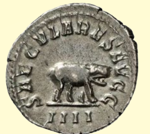
Kr. u. 248-ban Philippus Arabs császár hatalmas ünnepségsorozatot rendezett Róma fennállásának 1000. évfordulója tiszteletére. A császár pénzérméire is rátették az amfiteátrumi küzdelmekben felvonultatott állatokat.