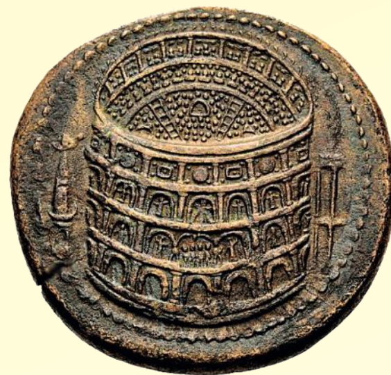
A Rómában található Amphitheatrum Flavium (Colosseum) képe Vespasianus császár pénzén.