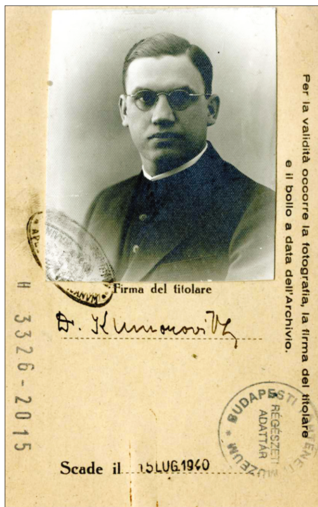
Fig. 5-6. Entry pass of Lajos Bernát Kumorovitz to the Vatican Secret Archives