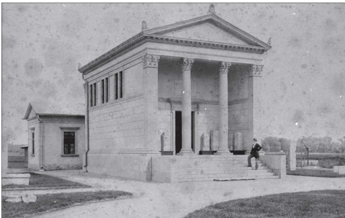
4. kép. Az Aquincumi Múzeum megnyitása 1894-ben