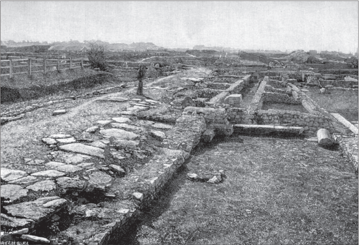
10. kép. Az első védőépületek az aquincumi polgárváros ásatásának helyszínén, háttérben a birkózókat ábrázoló mozaik feletti védőépület