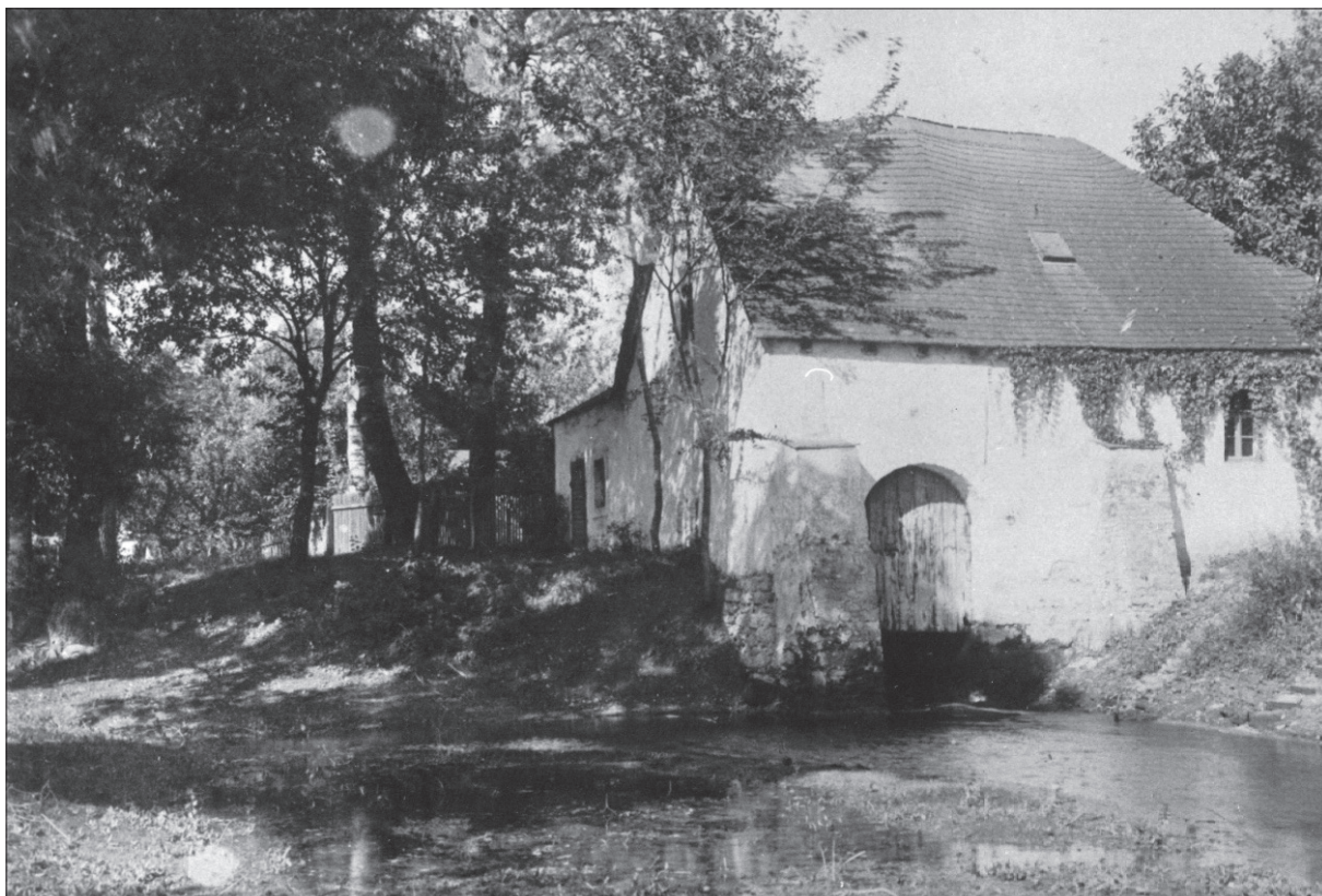
3. kép. Az aquincumi polgárváros területén kezdett feltárások szomszédságában, a város északi kapuján álló Krempel malom a 19. század végén, ahol az aquincumi leletek első helyszíni kiállítása volt.