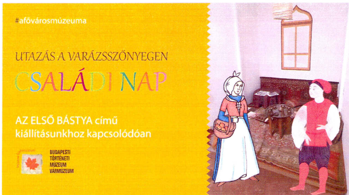
Utazás a varázsszőnyegen – Családi nap a BTM Vármúzeumában / 2019. október 27. - facebook esemény borítója