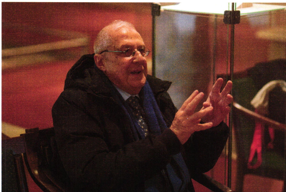
Prof. Dimitrios Pandermalis, az athéni Acropolis Museum igazgatója