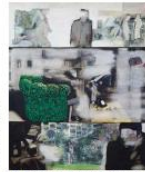
Journal du monde / Világok, 1966