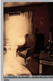
La chambre au Moulin / Szoba Moulin-ban, 2002

L'artiste a quitté la Hongrie après les événements d'octobre 1956. Il s'est installé à Paris en 1957 où il a vécu et travaillé jusqu'à sa mort en 2009. Lors d'un incendie qui a ravagé son atelier en 2007 nombre de ses oeuvres ont été abîmées ou complètement brûlées.