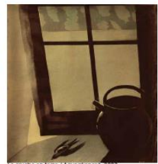
La rouche en terre / Agyarak jancsó, 2007

Ses oeuvres sont présentes dans les collections du Fonds National d'Art Contemporain, et une nouvelle génération de street-artists, pratiquant plus simplement la technique du pochoir, découvre aujourd'hui, avec ses murs peints à Paris, cet artiste précurseur.