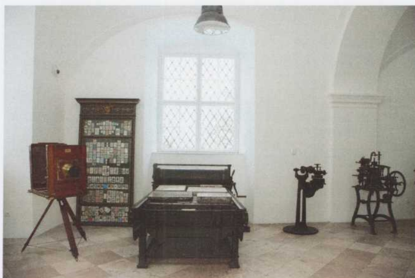
Fényképezőgép a Klösz Nyomdából Josef Wanaus & Co. Bécs; optika: J. H. Dallmayer, 1900 körül