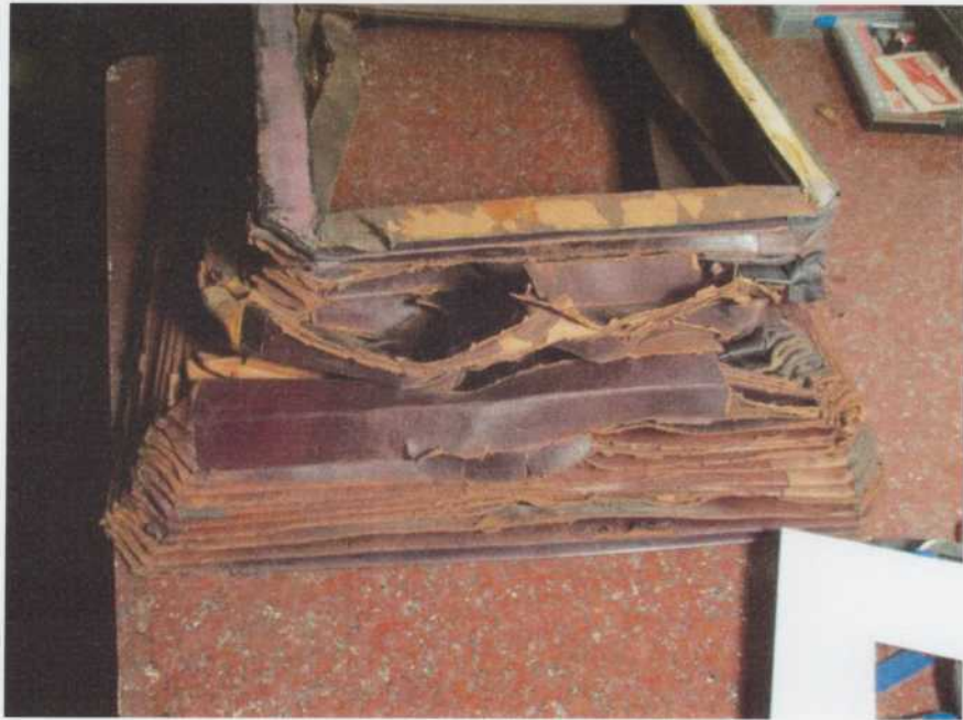
A harmonika lebontás után