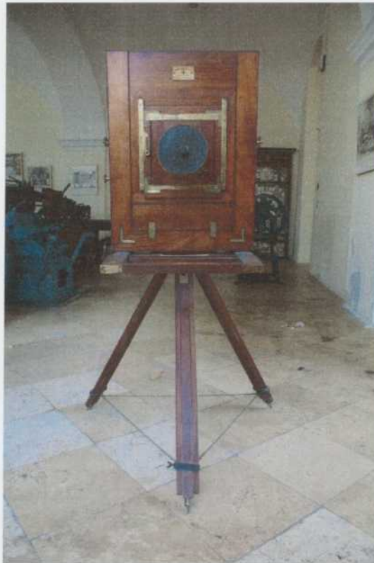
A kamera a restaurálás megkezdése előtt

A harmonika tervezett tartószerkezetére nem volt szükség, mivel a kiegészítések miatt a szerkezet önhordó lett.