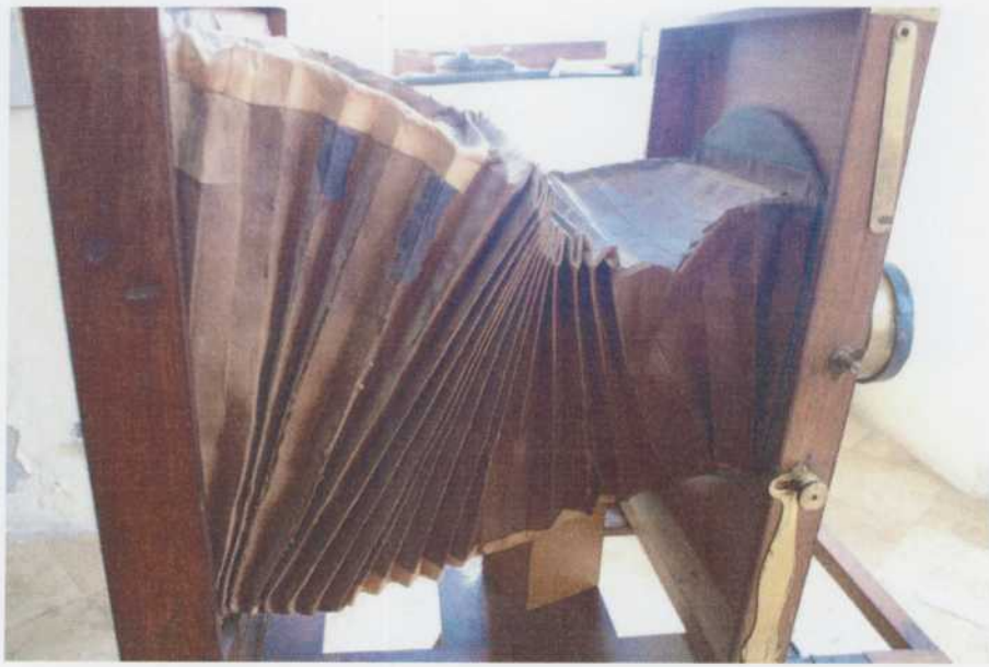
A sérült, károsodott bőr harmonika