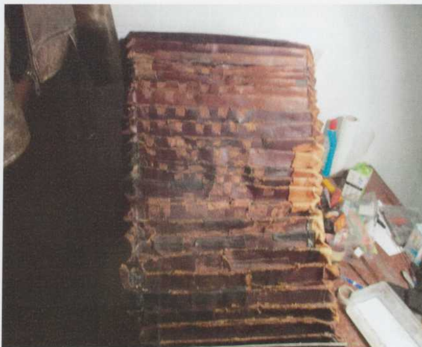
A bőrharmónika a korábbi kiegészítések eltávolítása közben