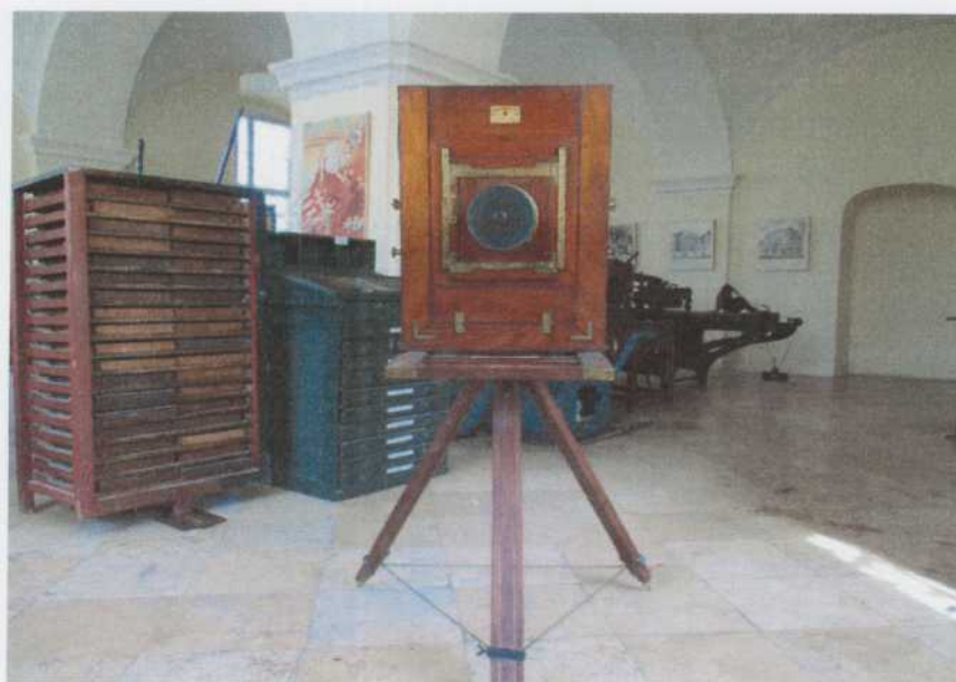
A kamera és az állványa