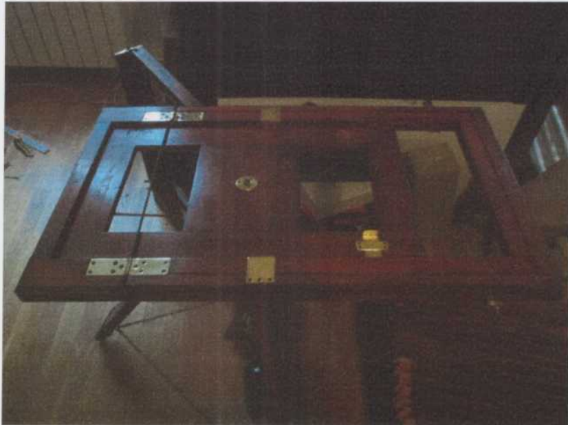
A megtisztított fém és fa alkatrészek